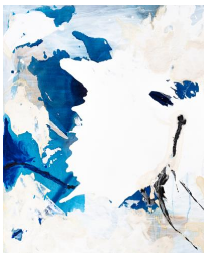
Bahar Heidarzade DIECIANNI 2018-21 tecnica mista su tela cm. 120x120