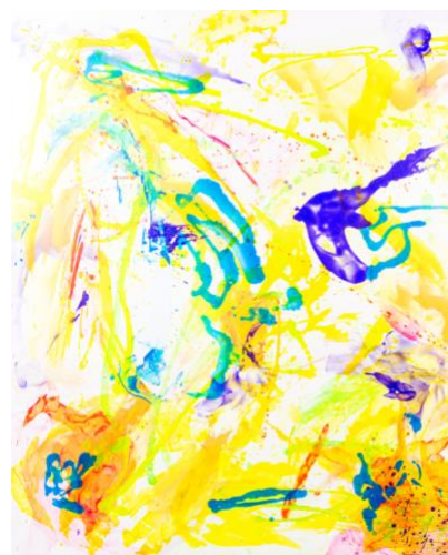
Bahar Heidarzade DIECIANNI 2018-21 tecnica mista su tela cm. 200x200